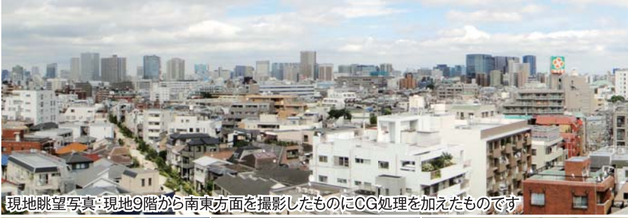
現地眺望写真:現地9階から南東方面を撮影したものにCG処理を加えたものです

駅3分にして、武蔵小山商店街を眼下にする好立地。 スカイツリーから富士山まで見わたせる、開放感のある眺望。 ここには、快適な暮らしのすべてがあります。