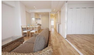
最大20.3帖の可変リビング