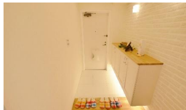
目映いホワイトレンガタイル