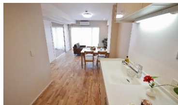
全面 オーク無垢材フローリング 人工大理石シンクのキッチン