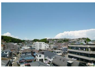
☆ 窓からの眺望です。